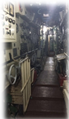
Fragata Dom Fernando II e Glória e Submarino Barracuda