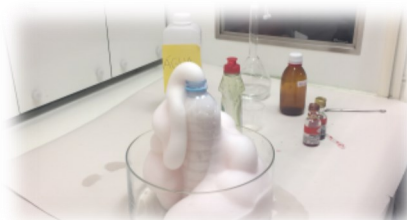
Pasta Mágica (Aquafresh)

“Se um tesouro querem encontrar, durante a Semana do Mar, num submarino vão ter que viajar. Por trás de um vulcão ele vai estar, nem comida nem água vão encontrar, para sobreviver a esta aventura vão ter muito que lutar”.